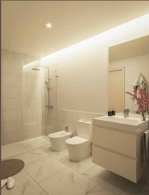
Casa de Banho Bathroom

Os apartamentos, de tipologias T1 e T2, apresentam uma configuração ampla e contemporânea, com linhas modernas, e espaços adornados com acabamentos de nível superior.